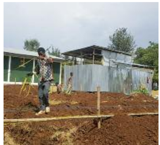
Inizio lavori fundamenta cucina e mensa a Laku (Etiopia)