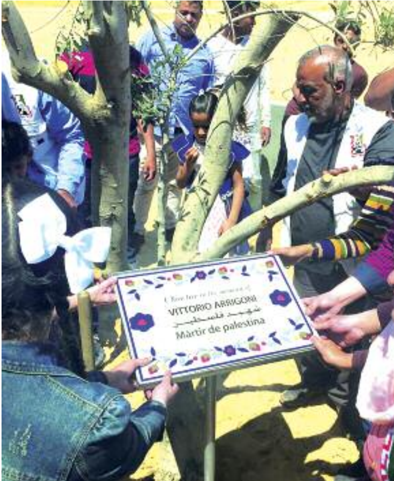
"Olivo dedicato a Vittorio piantato a Al Qatatwa - Striscia di Gaza